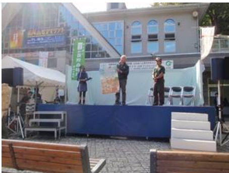
会場ステージにて広報活動