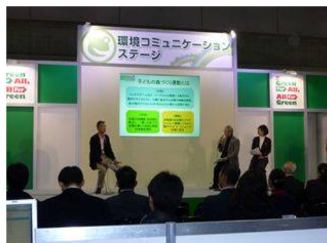
活動プレゼンテーション