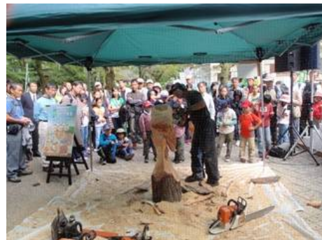
チェーンソーカービング・デモ